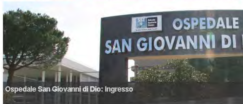
Ospedale San Giovanni di Dio: Ingresso

Home | Urp | Numeri Utili | Ospedali | Concorsi | Per I Medici | Dedicato A... | PEC